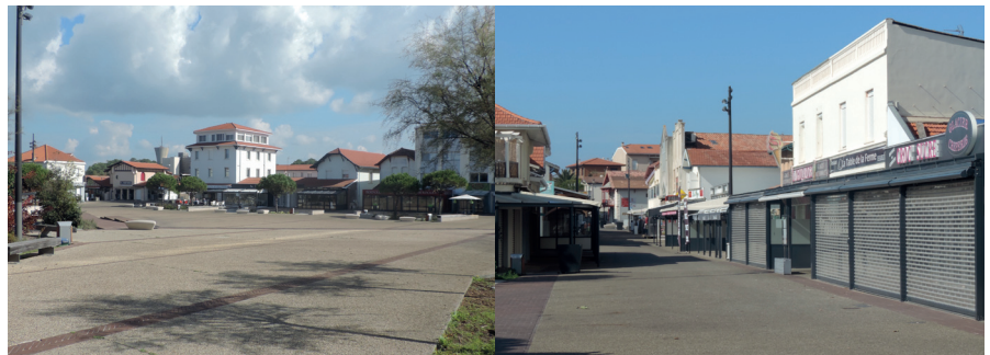
Place du Marché