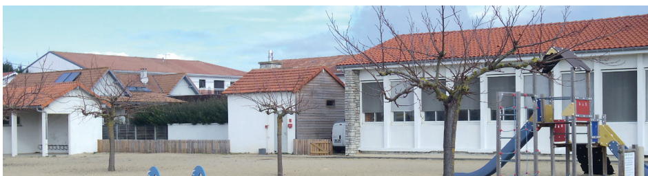
Ecole de la Plage

En 10 ans, l'effectif total des élèves inscrits à Mimizan, toutes écoles confondues, est passé de 564 (année scolaire 2004/2005)