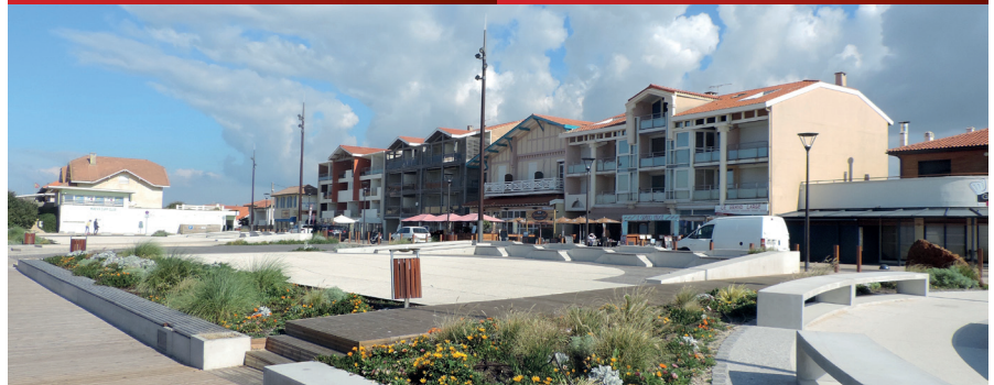
Place de la Garluche